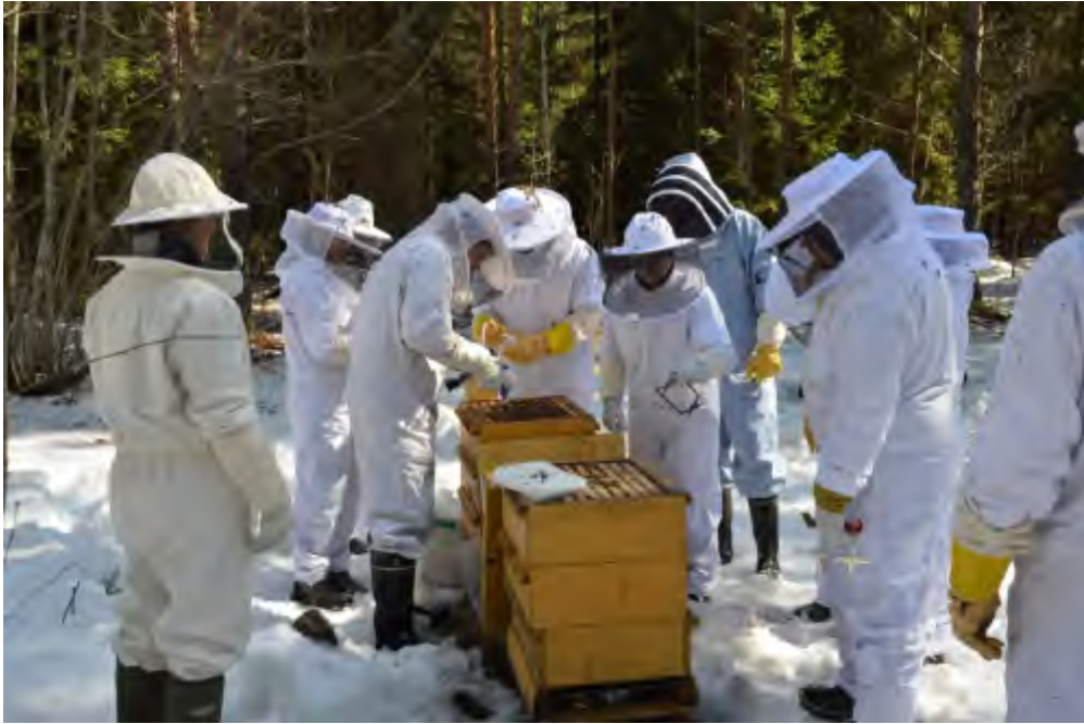
2013 kurssilaisia ensimmäisellä tarhakäynnillä.

Vanha kurssi ei ole vielä edes virallisesti päättynyt, kun uusia kurssilaisia on jo jonossa odottamassa helmikuun alkua ja uutta kurssia. Päätimme johtokunnassa selkeyttää ilmoittautumista ja kurssimaksun suorittamista. Meillä on aina ollut ongelmana se, että kurssille ilmoitaudutaan innolla, käydään kerta taikka kaksi taikka ei ollenkaan ja sitten hävitään jonnekin. Koska emme voi ottaa kurssille tolkuttomasti ihmisiä, niin nämä jahkailijat vievät paikan sellaiselta, joka kenties ihan oikeasti olisi halunnut opiskella mehiläishoitajaksi kanssamme.