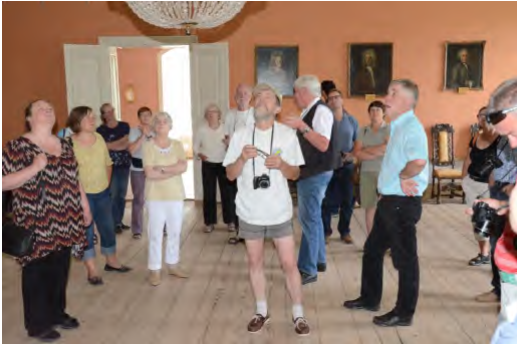
Turistit Sjundbyn linnassa.