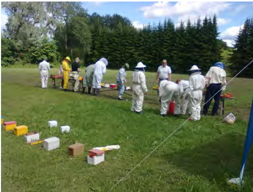
Parituspesien täyttöä kesällä.