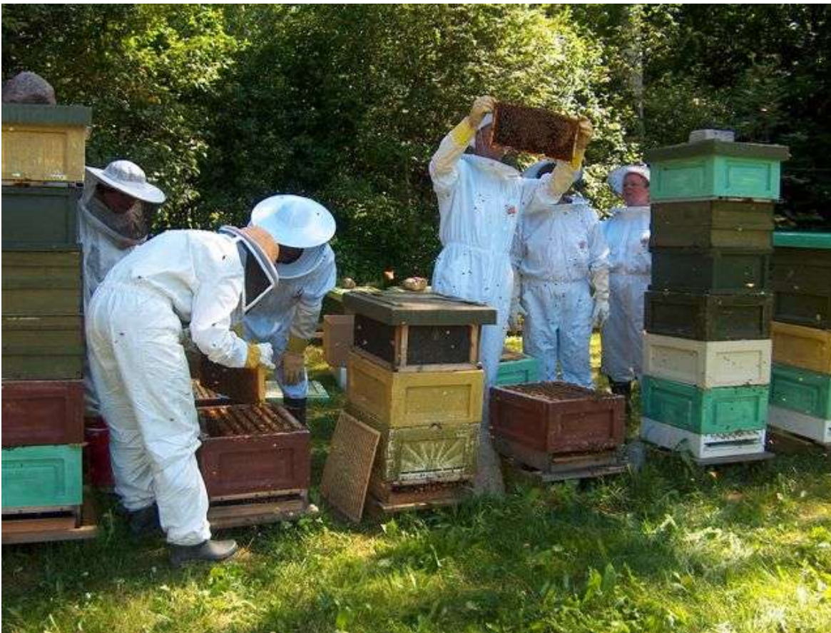
Ja tämänkin saatte kokea! Onko kukaan nähnyt kuningatarta?