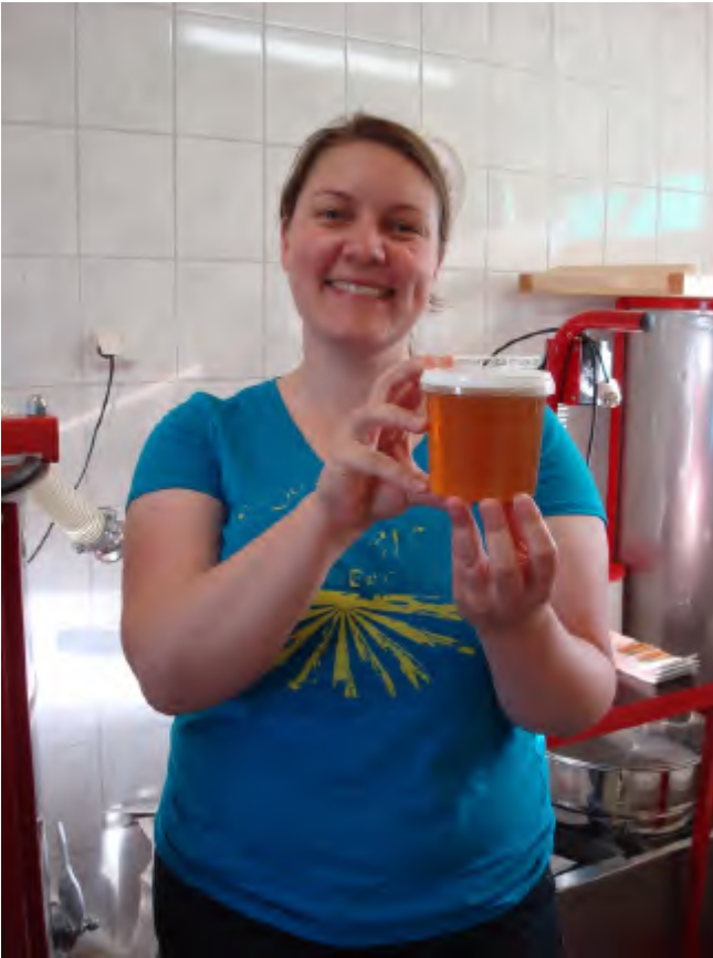
Eka purkki omaa hunajaa!