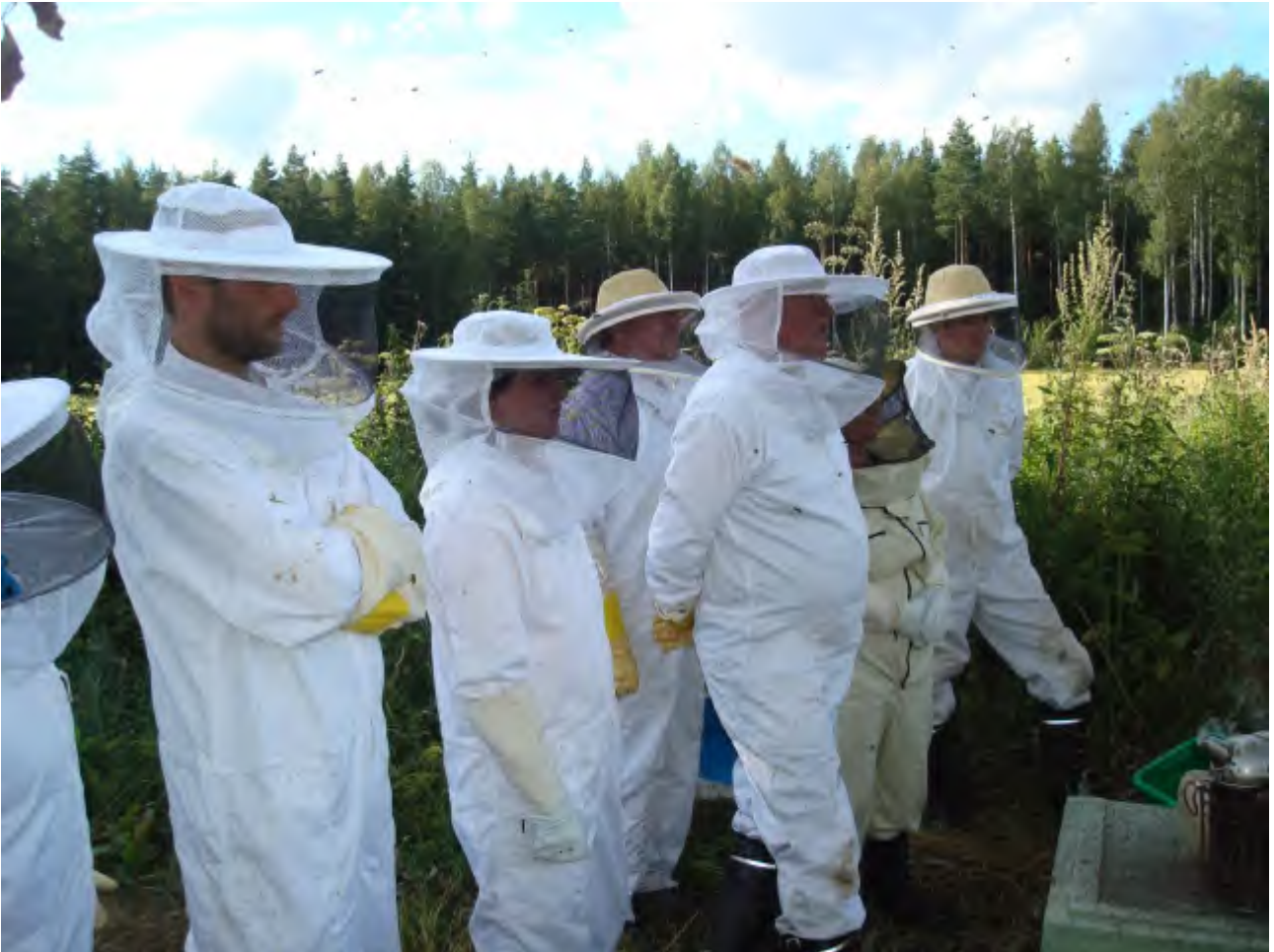
2012 kurssilaisia tarhakäynnillä.

Pidämme jälleen mehiläishoitokurssin yhdistyksen omin voimin. Näemme kurssin järjestämisen yhdistyksen perustehtäväksi. Kurssin tarkoitus on taata niin mehiläistalouden kuin yhdistyksenkin tulevaisuus.