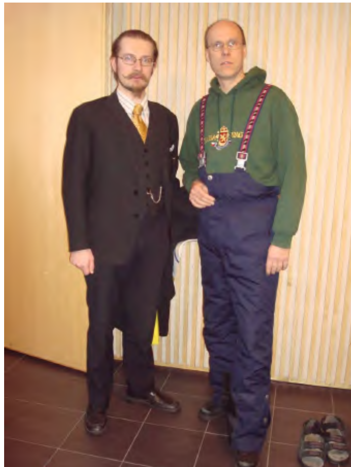
Kaksi puheenjohtajaa. Voi meitä...